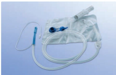
Irrigationsset geschlossen, mit Ventil, steril