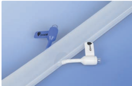
Irrigations (blau)- und Retentionskonnectoren (weiß)