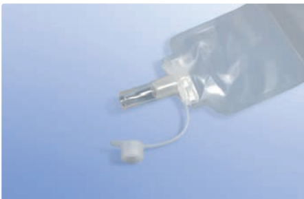
Konnektor für Ablaufbeutel