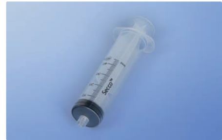
Einwegspritze zum Spülen, 45 ml