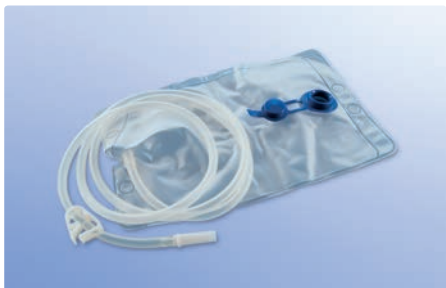
Irrigationsbeutel 2.000 ml, steril