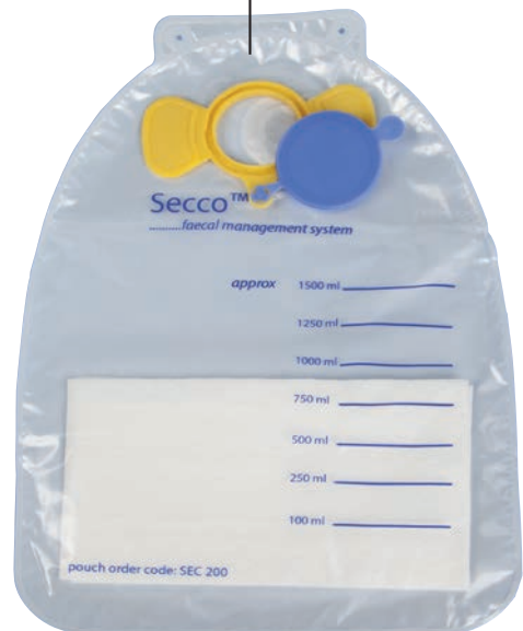
1.500 ml Auffangbeutel mit Superabsorber