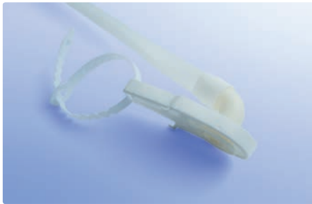
Aufsatzplatte mit Aufhängeband