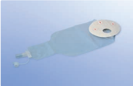
Fäkal-Kollektorbeutel, selbstklebend, mit Konnektor für Ablaufbeutel